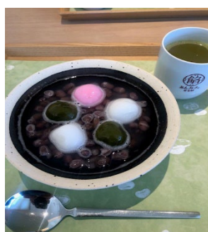
《養老軒カフェのぜんざい》