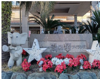
《可児市 湯の華アイランド》