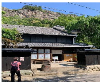
《古民家カフェ 九兵衛》