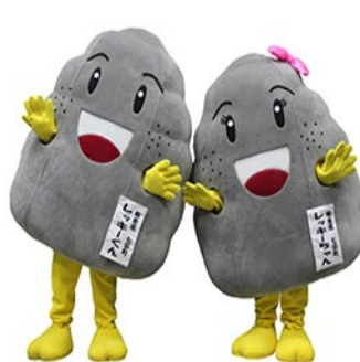
《七宗町のゆるキャラ》