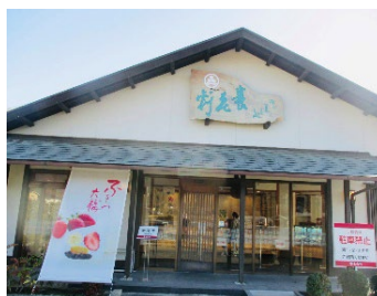
《フルーツ大福養老軒本店》