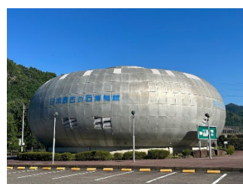
《日本最古の石博物館》