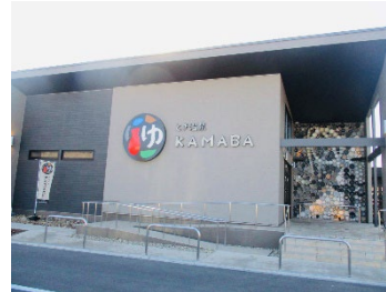
《イオン土岐 天然温泉 KAMABA》