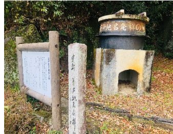
《釜戸地名発祥の地》