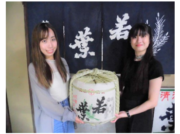
《東美濃の地酒 若葉》