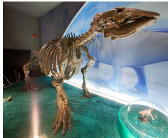
《瑞浪市 化石博物館》