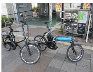
《ミニベロ電動アシスト》

ツアーガイドが安全にあなたのペースに合わせて長距離ライドを楽しくサポートします。