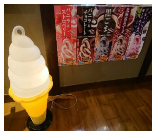
《湯あがりソフトクリーム》