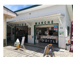
《道の駅 志野・織部》